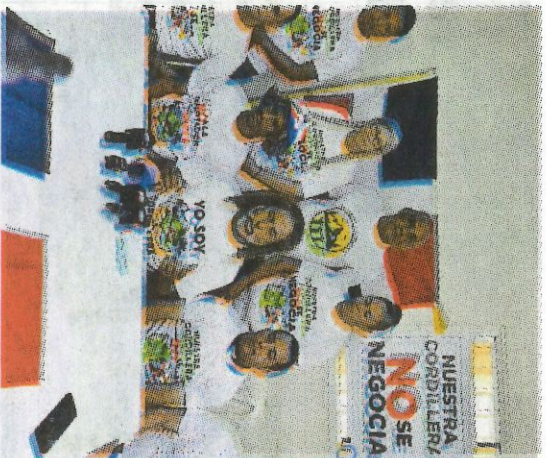
Sacerdotes denuncian que son perseguidos por el DNI. CHARLI MARTIN